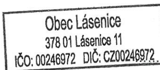
Rudolf Hronza zástupce zadavatele